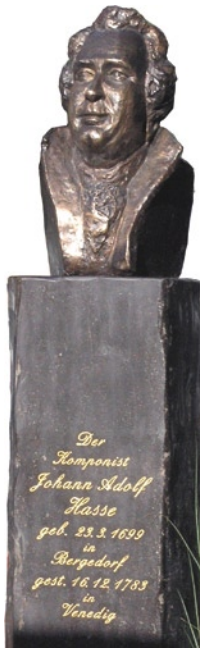
Künstlerin: Gisela Varzandeh

Der im Jahr 2002 von Liebhabern der klassischen Musik gegründete Verein und der „Freundeskreis der Bergedorfer Musiktage“ wollen mit ihrem Engagement Musikinteressierten den Besuch von Veranstaltungen weiterhin zu zumutbaren Konditionen ermöglichen und den Fortbestand der Veranstaltungsreihe für die Zukunft sichern.